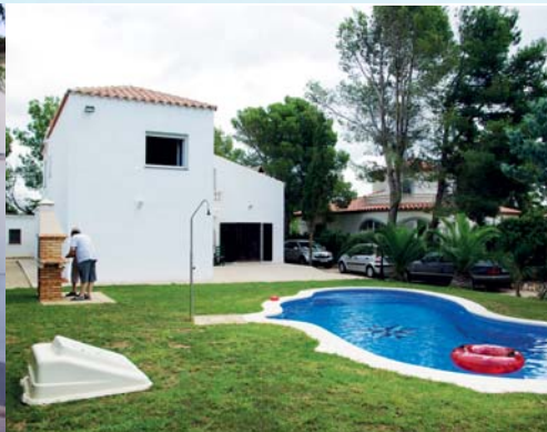
L'Ametlla de Mar (Tarragona)